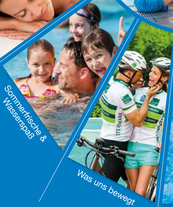
Sommerfrische & Wasserspaß