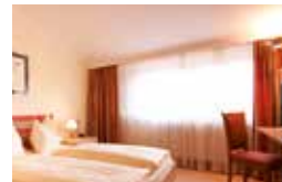
PICCO (22 m 2 )