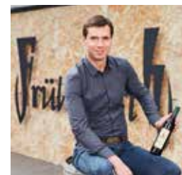
Fritz Frühwirth Weingut in Klösch

VINOBLE COSMETICS ist heimische Kosmetik aus der Kraft der Traube, die Ihre Haut glücklich macht. Vegan. Nachhaltig. Unisex. Made in Austria.