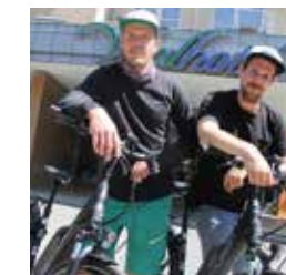
Frankl & Mitterer Fahrradfachgeschäft

Feinschmecker schätzen unser Kürbiskernöl, welches vielfach ausgezeichnet ist und mit viel Liebe in der eigenen Ölmühle produziert wird.