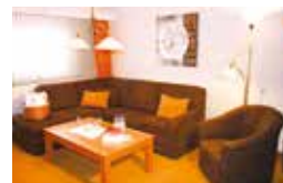
APARTMENT (48 m 2 )