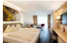
DONATELLA (39,5 m 2 )