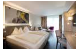
CAESARE (36,5 m 2 )