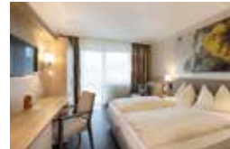
BRAVO (28 m 2 )