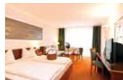
CAESARE (36,5 m 2 )