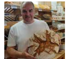
Familie Lang Bäckerei mit Tradition

Als regionaler Fahrradhändler freut es uns sehr, das Vitalhotel zu unseren Kunden zu zählen, denn wir zeichnen uns nicht nur als Lieferant, sondern auch als Service-Leister aus.