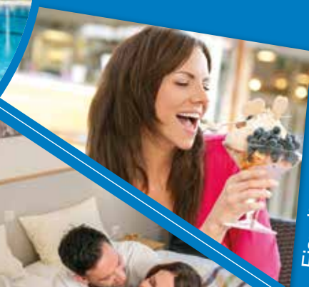
Eiszeit im Eissalon