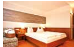
BRAVO (28 m 2 )