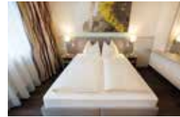
APOLLO (26 m 2 )