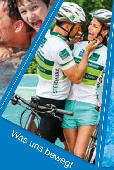
Was uns bewegt