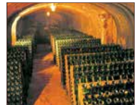
Sekt- & Weinkellerei Gornja Radgona ca. 1 km | zu Fuß erreichbar

SONSTIGE AUSFLUGSZIELE IN DER REGION: Haus- und Wassertechnikführung (kostenlos), Kellerführung in der Parktherme (kostenlos), Stadtführung, Museumsführung, Pechmanns alte Ölmühle (mit Buschenschank).