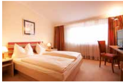
APOLLO Kuschelzimmer (26 m 2 ) mit Balkon, auch mit Parkettboden verfügbar