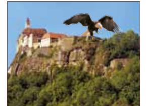
Riegersburg Burgbesichtigung & Greifvogelwarte ca. 42 km | Fahrtzeit: 50 Min.