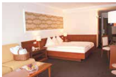
DONATELLA DOLCE VITA- Doppelzimmer (39,5 m 2 ) Komfortzimmer mit Blick in den Toskana-Garten, Balkon mit Morgen- & Nachmittagssonne