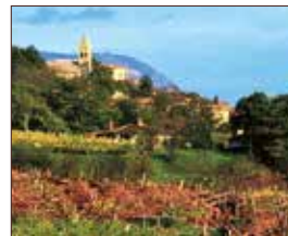
Weinreise - Jerusalem Radgona ca. 34 km | Fahrtzeit: 40 Min.