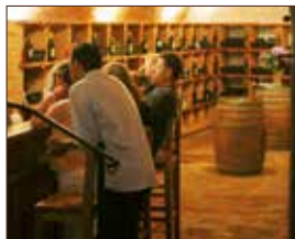
Vinoteken in Bad Radkersburg, Klösch und St. Anna/Aigen ca. 500 m/8 km/15 km