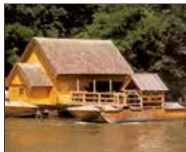
Schiffsmühle Mureck ca. 25 km | Fahrtzeit: 30 Min.