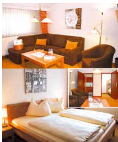
APARTMENT (48 m 2 ) Wohnluxus pur für alle, die mehr Platz brauchen oder als Familienapartment. Im Dachgeschoss, ohne Balkon. Vorraum, Bad und WC (getrennt), Schlafzimmer, Kochnische, Schlafnische mit Stockbett, Nachmittagssonne.