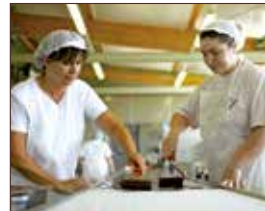
Zotter Schokoladenmanufaktur ca. 42 km | Fahrtzeit: 50 Min.