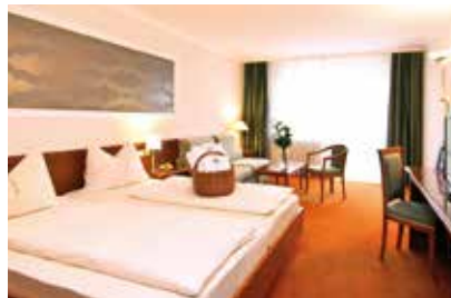
CAESARE Wohlfühl-Doppelzimmer (36,5 m 2 ) mit Wohnlandschaft und Blick zur Parktherme, ge- eignet für Familien bis 4 Personen