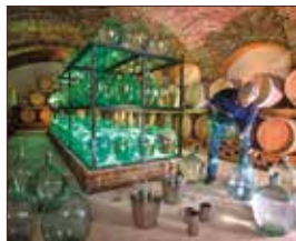
Gölles Schnaps- & Essigmanufaktur Riegersburg ca. 42 km | Fahrtzeit: 50 Min.