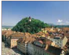
GRAZ Landeshauptstadt ca. 80 km | Fahrtzeit: 60 Min.