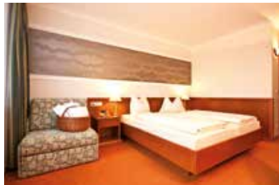
BRAVO Klassisches Doppelzimmer (28 m 2 ) mit Couchelement und Balkon