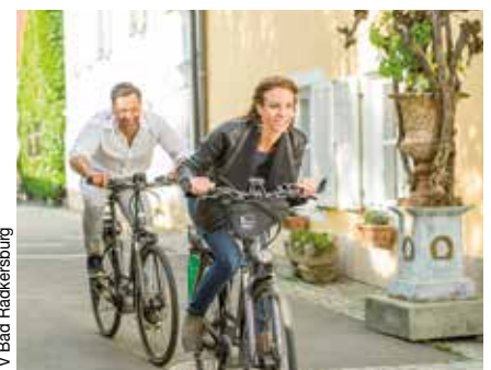
TV Bad Radkersburg