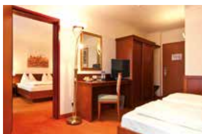
BRAVO X 2 Für alle, die viel mehr Platz brauchen, ideal als Familienzimmer