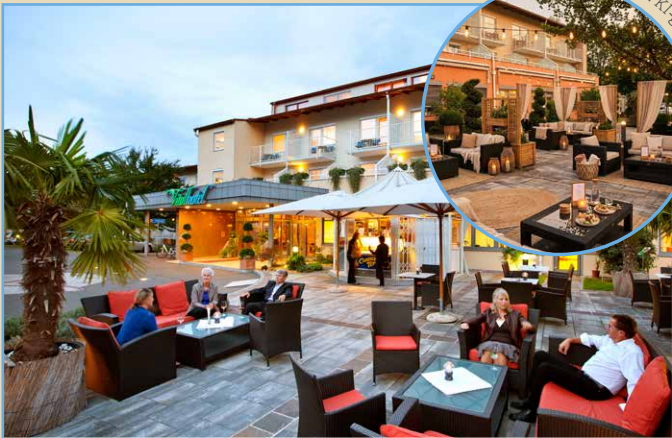
Vorschau bild: KI-generiert