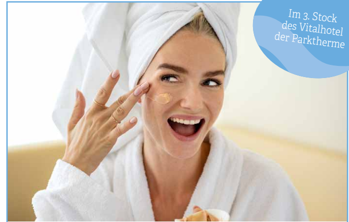
Im 3. Stock des Vitalhotel der Parktherme